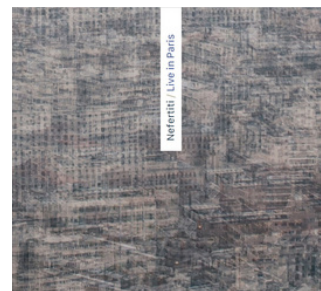
LIVE IN PARIS ZENNEZ / BERTHOLD 2023