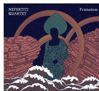
FRAMELESS NEUKLANG 2022